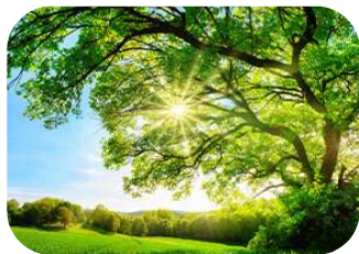
サステナビリティ